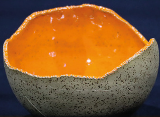
Donica „Lawa z głębin”