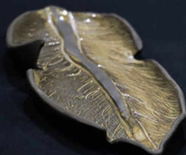
Talerz „Pióro strusia”