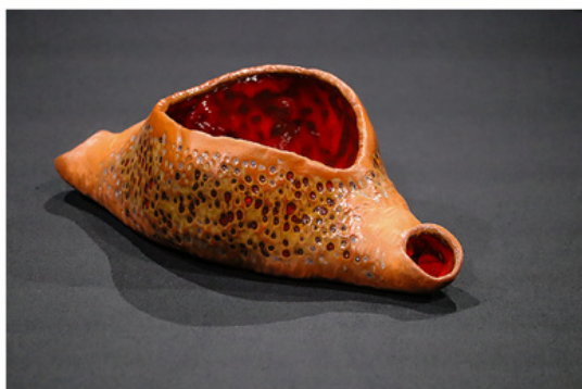
Aba Warszewska-Nobis „Owocowa rozkosz”