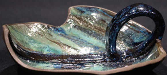
Liść z uchem „Śnieguliczka biała”